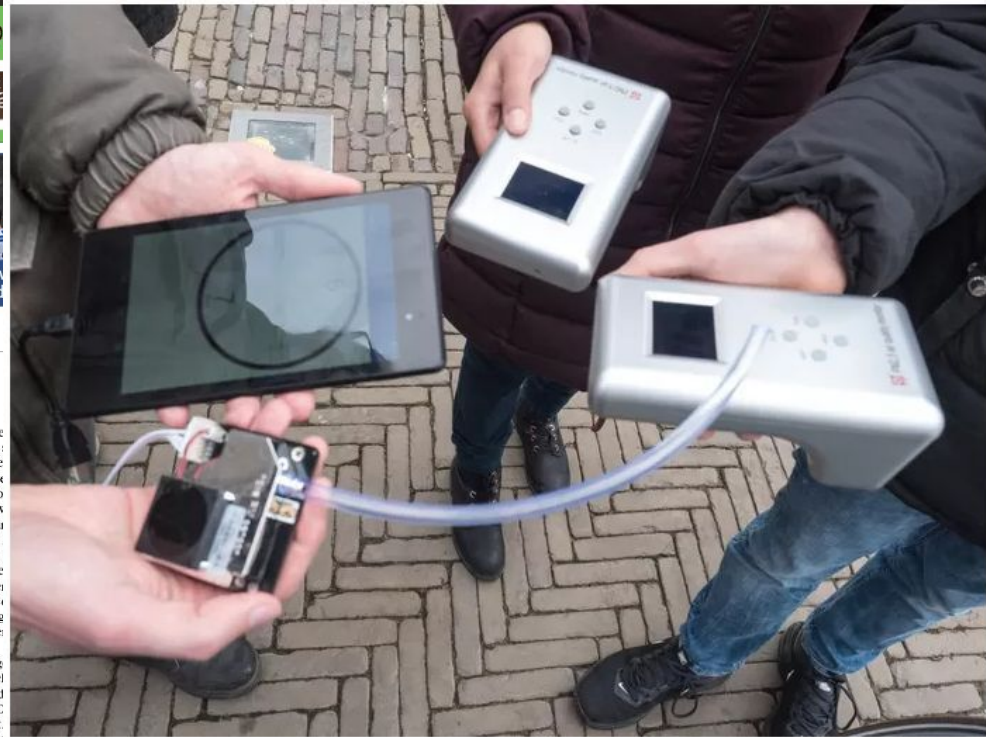
▲ 'Luchtwachters' tonen hun fijnstofmeter.

De Luchtwachters Delft dels een experiment, w die bevestigd worden aa van Molen de Roos, in d maanden nog meer bela te verzamelen. Want, hoe doeken, hoe meer gevaai en dus meer gezondheid! Woensdag 20 februari 19.30 uur, vindt er in T veld een politiek café als onderwerp 'Fijn stof